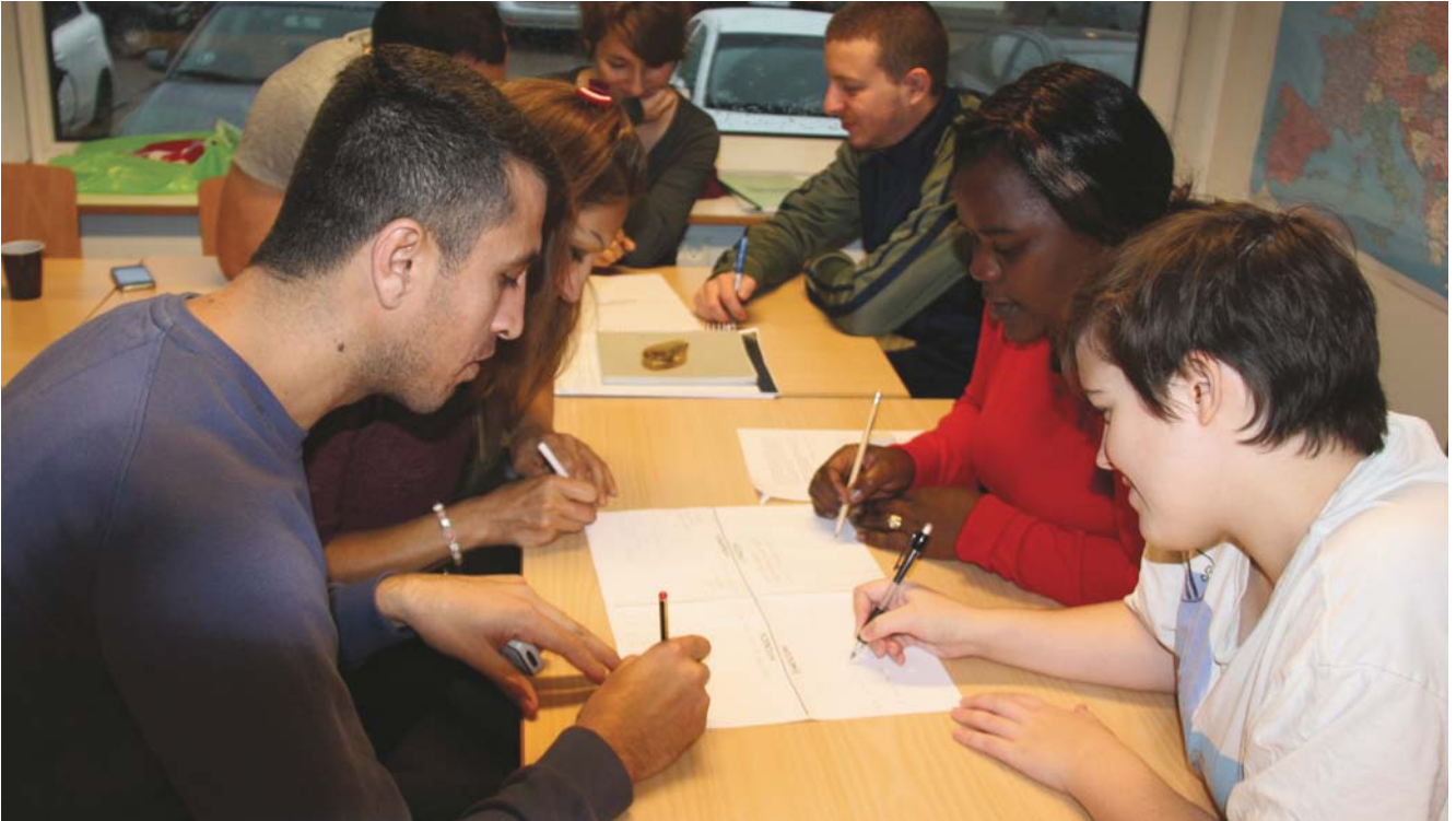
Brainstorm om livsfaser som indledning til emnearbejde om alderdom. Det gøres i grupper, så der er gensidig hjælp til ordvalg og stavning.

Danskuddannelse 3 (DU3) er tilrettelagt for kursister, der har mindst 12 års skolegang og som regel også en mellemlang eller lang uddannelse bag sig. Der er tale om studievante kursister, der forventes at have en hurtig progression ligesom det forventes, at de deltager aktivt i undervisningen, tager ansvar for egen læring og har mulighed for at lave hjemmearbejde. DU3 foregår først og fremmest på almindelige dag- og aftenhold på sprogcenteret, men også som fjernundervisning og blended le-