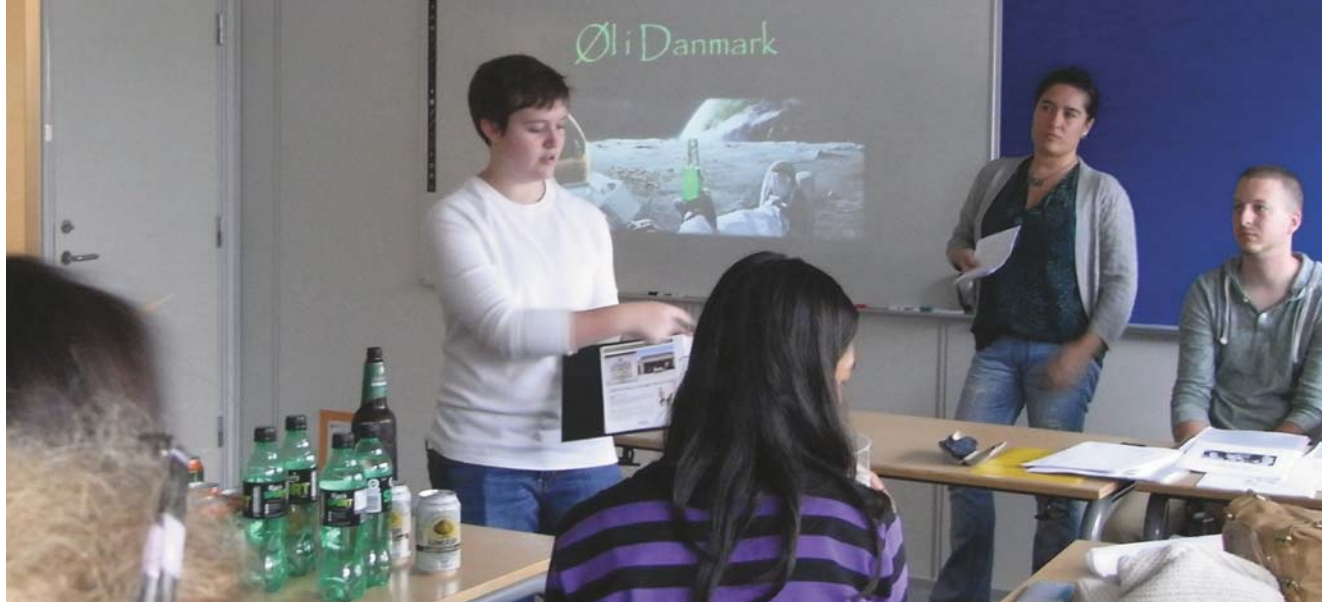
Projektfremleggelse på Sprogcenter Fredericia