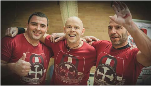
Kettlebell giver sidegevinster i form af danske venskaber og kontakter og dermed også et større tilhørsforhold til landet.