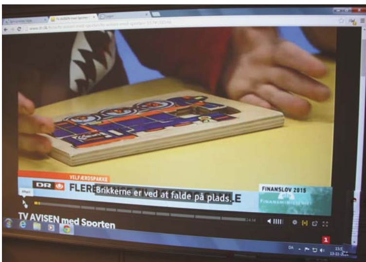
dr.dk bliver flittigt brugt i undervisningen. De interaktive tavler fungerer som storskærm, og der kan pauses og gentages og tekstes, så der kommer fokus på såvel indholdsmæssige som sproglige aspekter.

grundbogs- eller netbaseret undervisningsmateriale, og ellers tages der så vidt muligt udgangspunkt i kursisternes egne erfaringer og behov fra hverdagsliv, arbejde og uddannelse. Der arbejdes samtidig med basale sprogstrukturer (grammatik) og ikke mindst med den danske udtale i forhold til såvel lytteforståelse som mundtlig sprogproduktion. Da kursisterne tidligere har lært fremmedsprog og dermed har en vis sproglig bevidsthed, kan der "skydes genvej" til det danske sprog, fordi vi kan forklare sproglige særegenheder, strukturer og betydninger, og hvis det kniber, tage engelsk eller andre fællessprog til hjælp. Der arbejdes dog lige fra starten intenst på, at etablere et dansk ordforråd til brug ved sprogindlæring, fx "Hvad betyder det?" Og "Hvorfor siger man sådan på dansk?", således at kursisterne med det samme vænner sig til at kommunikere på dansk.