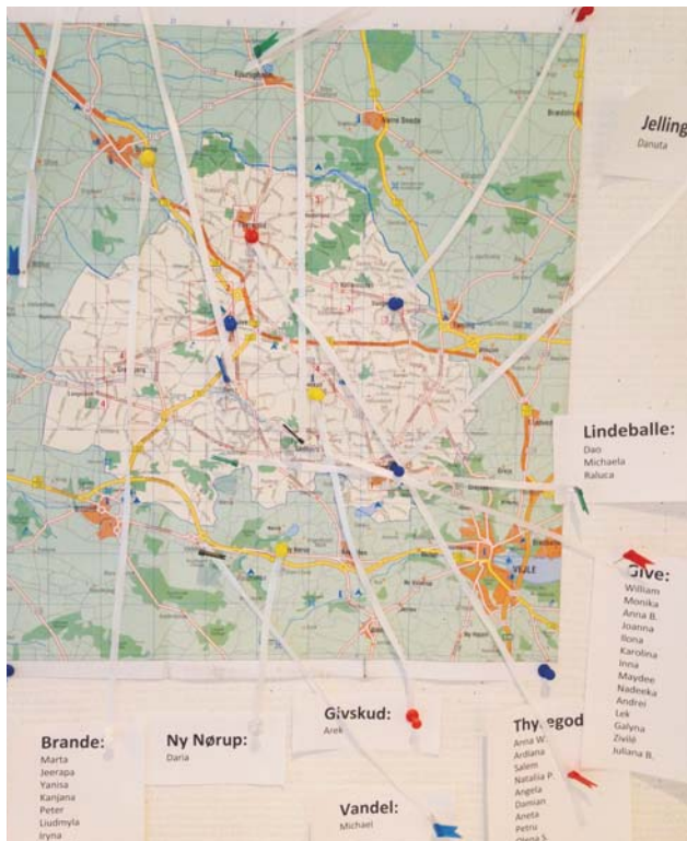
Kort som viser elevernes boliger i Give Kommune.