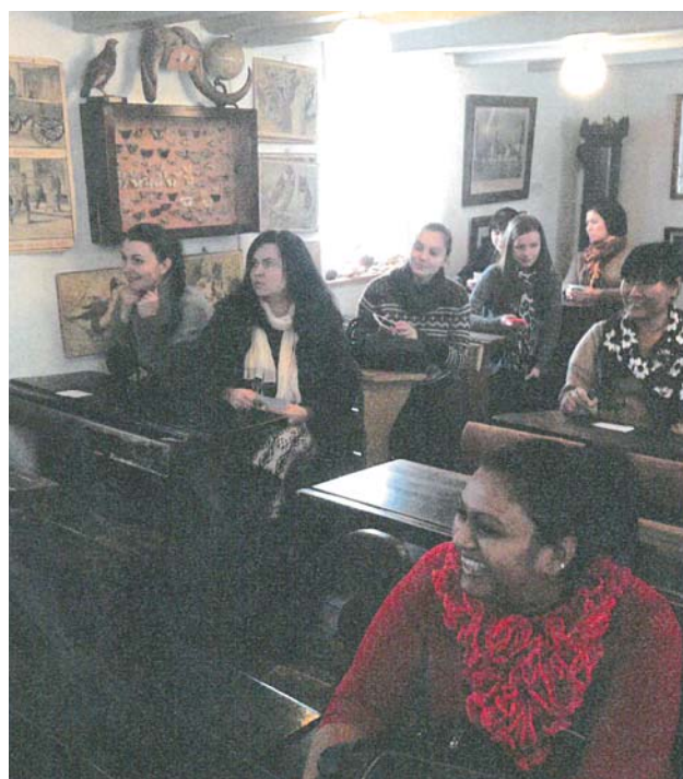
Eleverne lyttede opmærksomt til historien om hedebondens liv på egnen omkring Give.

I efterbearbejdningen har nogle kursister fået en opgave om at skrive til en ven i deres hjemland og fortælle om deres by og omegn i Danmark, hvor de bor nu. Det var et par lærerige uger både sprogfagligt og socialt mellem kursisterne.